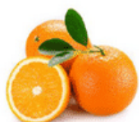
Doc. 1 • Les oranges

1 orange donne 35% de son volume en jus.