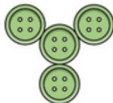
Motif n° 1