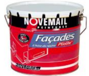
PEINTURE FAÇADE PLIOLITE®