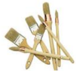
Lot de 7 pinceaux 17€20